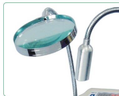
放大镜和局部照明灯